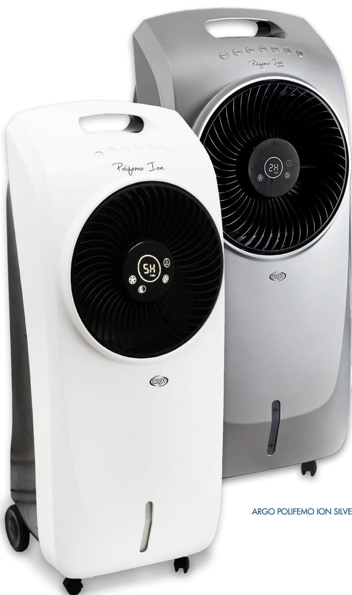
ARGO POLIFEMO ION SILVER